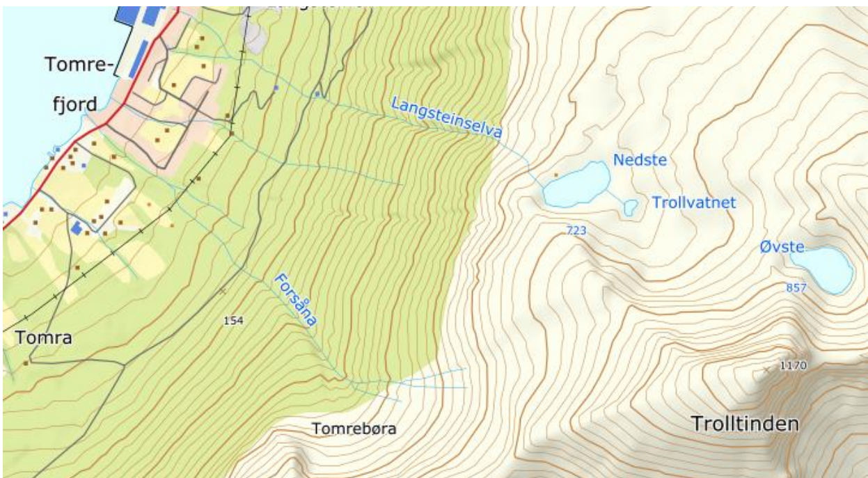
Der Norgeskartet har Nedste Trollvatnet er det foreslått Kvennåvatnet og Brustindvatnet