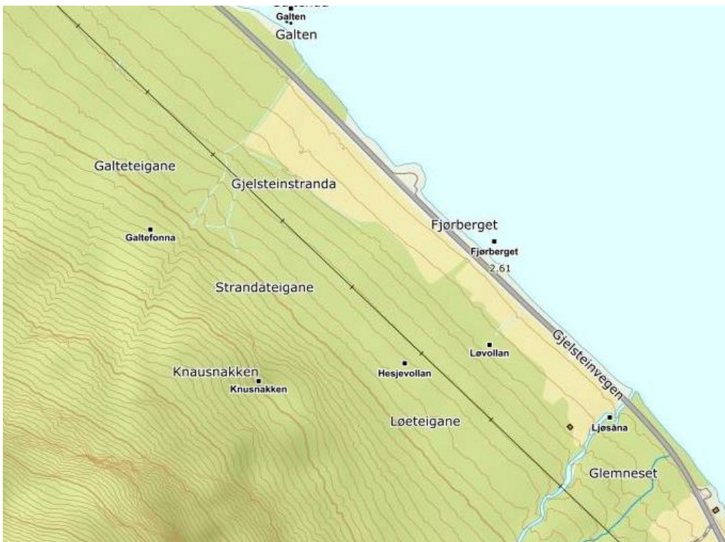
Knausnakken frå Norgeskart, Knusnakken frå stadnamninnsamlinga i fylkesatlas