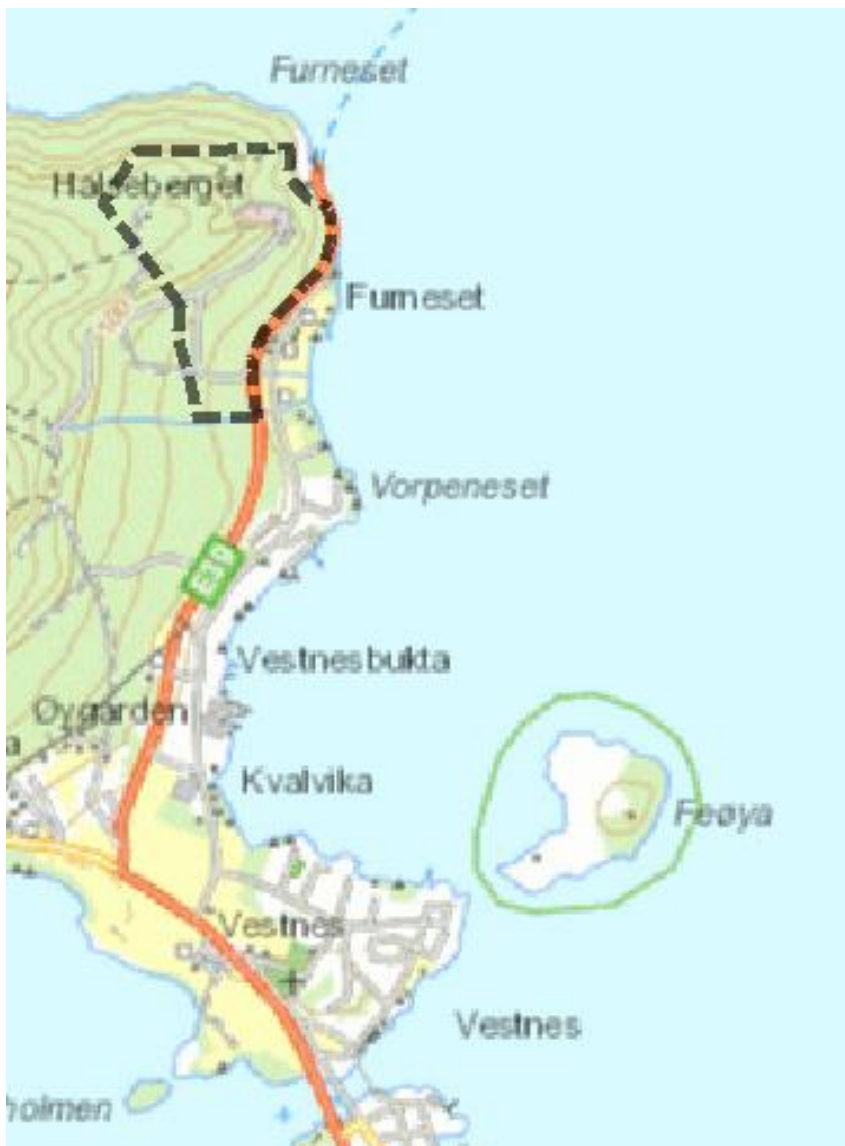
Figur 1 Oversiktskart - Plangrensen vist med svart stiplet linje

Området ligger vest for Furnes fergekai. Fergekaien er en del av sambandet Molde – Vestnes på E39. Planområdet er avgrenset med svart stiplet linje, og er på 363.9 daa. Følgende figur viser et oversiktskart.