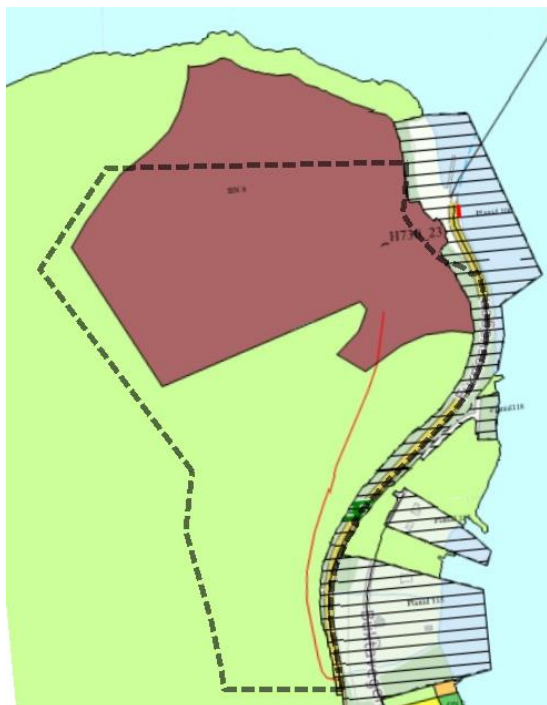
Figur 2 Kommuneplanen

Følgende figur viser et utsnitt av kommuneplanen. Området er i kommuneplanen avsatt til råstoffutvinning (brunt) og LNF (grønt). Det er med rødt vist en veiforbindelse mellom bruddet og E39. Reguleringsplanens grense er vist med svart stiplet linje.