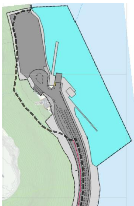
Figur 3 Furneset fergekai

Tilgrensende reguleringsplan i øst er Furneset fergekai. Planen er vist i følgende figur.