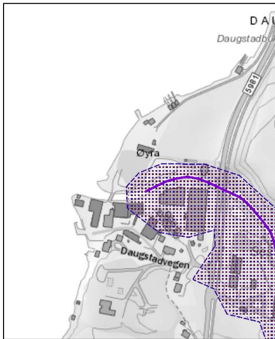
Aktsemdsområde flaum i elv

Stormflo Likeeins ligg deler av landområdet i dag innanfor område som vil bli oversvømt ved stormflo (200-års hending) I tillegg har Direktoratet for sikkerhet og beredskap berekna at havnivået vil kunne stige med inn til 73 cm innan 2100.