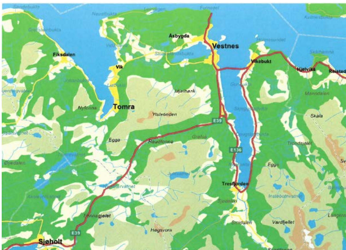
Figur 1 Kart over Vestnes kommune

Vestnes kommune har 6 611 innbyggere (2016) og ligger i Møre- og Romsdal ved E39 mellom Ålesund og Molde. Forbindelsen til Molde er med ferge over Romsdalsfjorden.