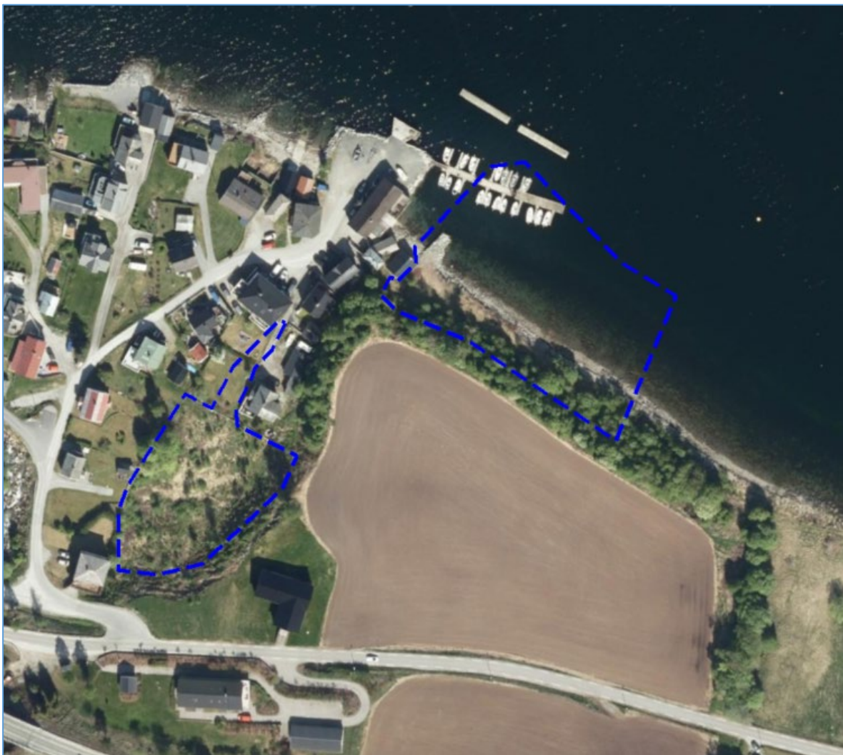
Figur. 1 Framlegg plangrense Reistaddalen, Vågstranda.

Etter forskrift om behandling av private forslag til detaljregulering etter pbl. skal det utarbeidast planinitiativ til kommunen seinast samtidig med førespurnad om oppstartsmøte etter pbl. § 12.8. Planinitiativet skal i nødvendig grad omtale premissane for det vidare planarbeidet, og gjere greie for punkta i § 1 til forskrifta.