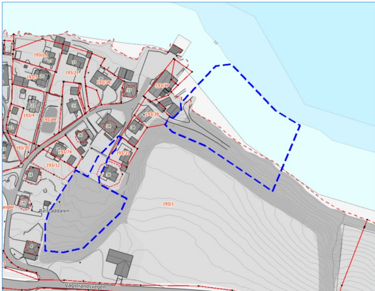
Figur. 5 Framlegg til plangrense over kart med eigdomsgrenser.

Plangrensa følgjer naturleg terreng avgrensing på land og går til kote -10 m i sjø. Arealet for heile planområdet er på omlag 8 daa, fordelt på om lag 3 daa til bustad og 5 daa til småbåthamn med nødvendig areal på land.