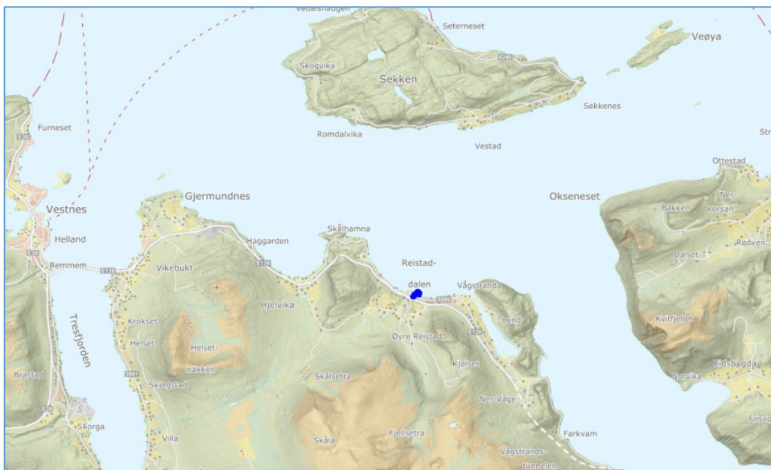
Figur. 2 Lokalisering av planområdet, markert med blå avgrensing.

Planområdet ligg i Reistaddalen, Vågstranda i Rauma kommune. På grunn av endring av kommunegrenser vil Vågstranda tilhøre Vestnes kommune etter årskiftet 2020/2021.