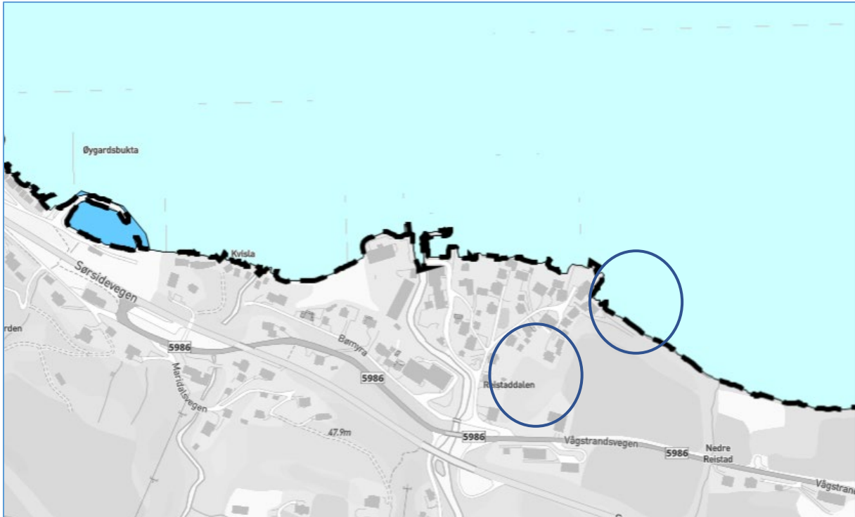
Figur. 4 Utsnitt av Sjøplanen, sjømråda innanfor planområdet har formål bruk og vern av sjø og vassdrag med tilhøyrande strandsoner. Blå sirkel indikerer planområdet.

Sjømråda innanfor planområdet ligg innanfor Sjøplanen, med formål bruk og vern av sjø og vassdrag med tilhøyrande strandsoner. Planen vart vedteken 05.09.2017.