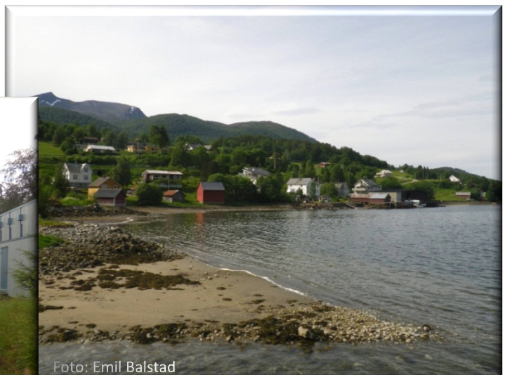
SYLTEBAKKEN I TRESFJORD